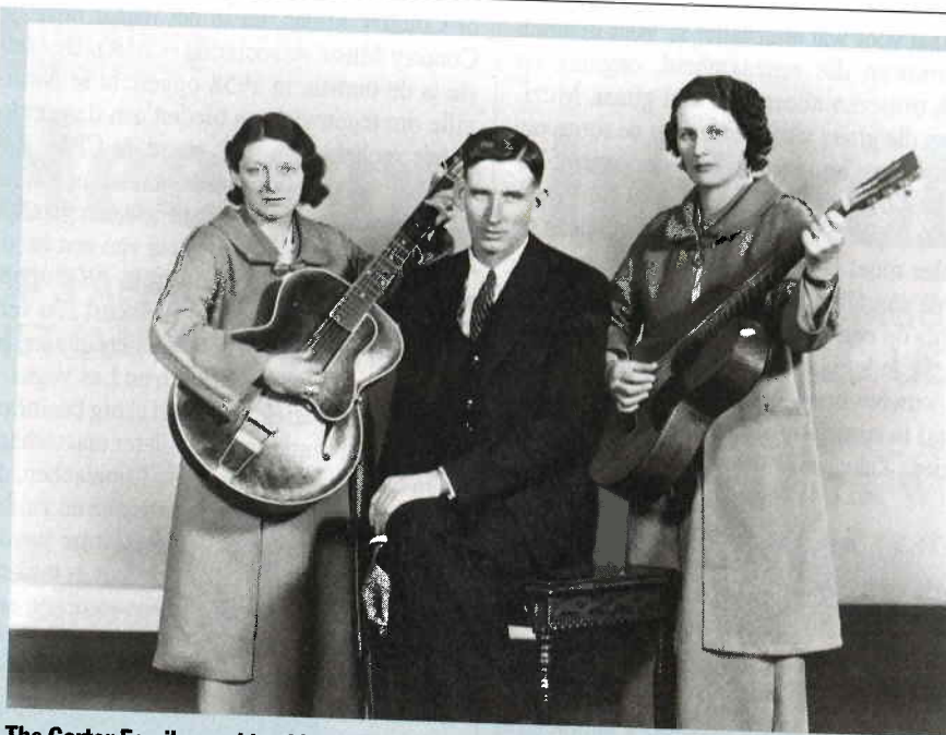
The Carter Family maakte al in 1927 opnamen, kreeg nationale en later internationale faam